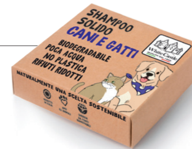
art. 1109 SHAMPOO SOLIDO CANI E GATTI 70g