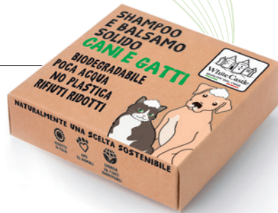
art. 1106 SHAMPOO E BALSAMO SOLIDO CANI E GATTI 70g