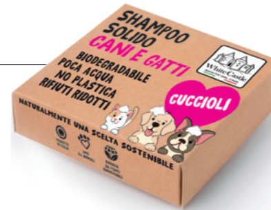
art. 1108 SHAMPOO SOLIDO CUCCIOLI 70g