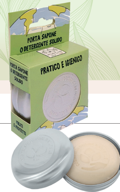
art. 1101 PORTA SAPONE DETERGENTE SOLIDO